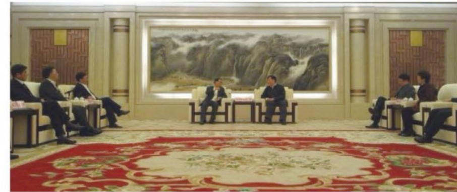
中共浙江省委常委、宁波市委书记刘奇会见兴业信托、杉立期货负责人

杉立期货成立于1994年，注册资本为1亿元，注册地为浙江省宁波市，是经国家工商行政管理总局登记注册，并取得中国证监会颁发的期货经营许可证的大型专业期货公司，同时也是上海期货交易所、大连商品交易所、郑州商品交易所会员以及中国金融期货交易所交易会员，具有商品期货经纪、金融期货经纪、期货投资咨询业务资格。除宁波总部外，杉立期货还设有上海、温州、台州、慈溪、余姚、鄞州、宁海七家营业部。作为股东的兴业信托系经国务